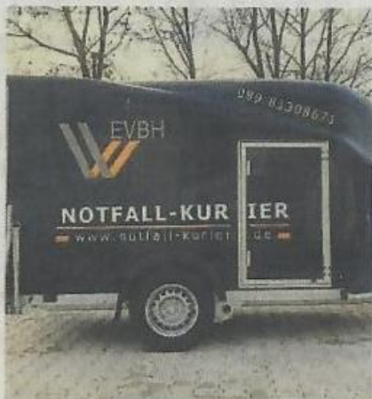
Der Notfall-Kurier des EVBH.

Dass der Zusammenhalt innerhalb von Puchheim gut funktioniert, zeigte sich gleich von Anfang an. Durch die Zusammenarbeit mit dem Puchheimer Stadtportal und dem Einkaufsverbund für das Handwerk (EVBH) konnten innerhalb kurzer Zeit über hundert Personen erreicht werden, die sich als Unterstützer für „Puchheim hilft!“ meldeten. Auch die weiteren Kooperationspartner wie das Mehrgenerationenhaus ZaP, der Katholische Pfarrverband Puchheim, die evangelische Gemeinschaft, die evangelisch-lutherische Kirchengemeinde und die evangelisch-freikirchliche Gemeinde mel-